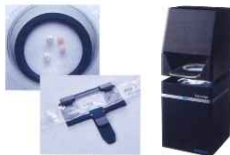
(持参薬鑑別支援装置)

持参薬の確認の際に活躍するのが、「持参薬鑑別支援装置」です。これは、一包化されているお薬の識別番号を写真で読み取り、薬品名と用法・用量を一覧にしてくれる機械です。この装置は去る10月と11月に行われた串本中学校と串本古座高校の生徒さんたちの職場見学会でも紹介させていただきました。錠剤には薬品名が書かれているものも増えてきていますが、以前は錠剤の識別番号を目で見て、本で調べるということを行っていました。鑑別装置導入後は短時間で正確に持参薬の確認ができるようになりました。